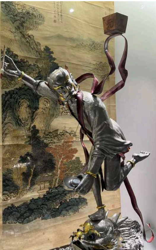
魁星踢斗（攝自鹿港民俗文物館）。

為國取才之道，傳承至今，在國父孫中山先生的五權分立理念下，強調權能區分與平衡，五權分立而相成，設