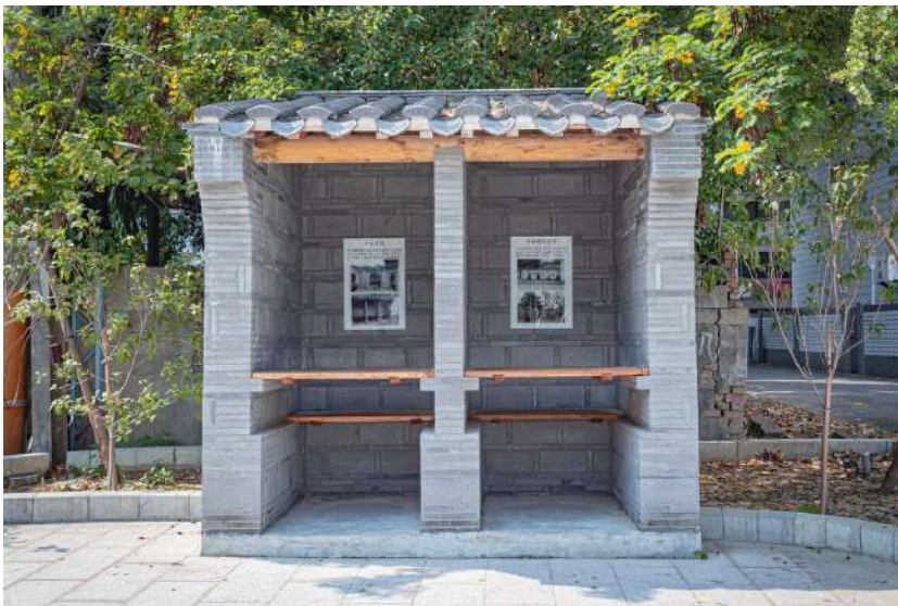
臺灣府儒考棚，位於台中。

隋朝開設科舉制度，改變了門閥士族把持選士的專權局面，讓民間學子有躍登龍門的機會。唐代科舉進一步完備，分為常科與制科，常科每年舉行，制科是皇帝臨時設置的科目。宋代再加以改良，宋太祖趙匡胤期間確立了解試、省