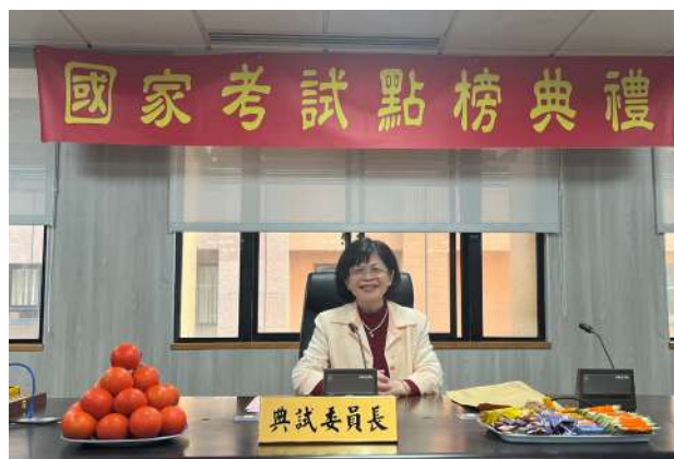
國家考試點榜典禮。

立了考試院，考試權獨立運作。考試院成立於民國19年，至今已逾90年。每項國家考試均由總統任命典試委員長主持，玉尺量才。考試分為兩大類：公務人員考試、專門職業及技術人員。國家選才制度多年以來屢有改革，從歷代科舉演變至當前國考制度，未來在政經社會變遷下是否會有改良工程，有待社會共識。