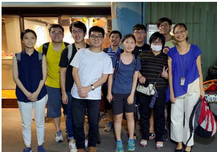
實驗室聚餐。右1為作者。

段很快樂與充實的日子。參加球隊可能讓念書的時間減少，但球隊團隊生活以及重複練習動作與戰術，所需的妥協、耐心、毅力與朝同一目標前進的訓練，對於之後面對生活上的問題和身體健康，都有幫助。因此，我也不時地叮嚀學生，要離開實驗室去運動、流汗，才能應付長期的研究生活，對於畢業之後的生活也有幫助。工作不應是生活的全部，好好分配，才能走得長遠且健康。