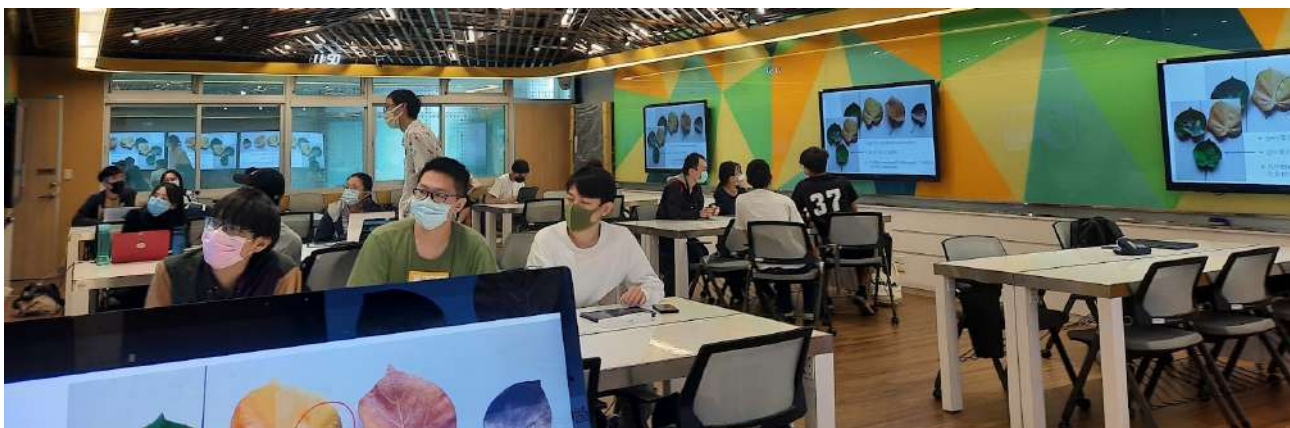
綜合401未來教室上課實景

除了「真正的老師」之外，同學也是我的老師。大家都來自不同的學校與背景，每個人都有擅長的面向，有的生化很好、有的微積分超強、有的很會點植物解剖圖、有的很會認植物與背植物學名等等，大家彼此學習/cover，一起努力讓必修課過關。而我都不擅長，但也還可以應付，唯一擅長的應該只有打籃球了。很幸運地，遇到喜歡打球的同學、學長姊、學妹，組成了一隊超強的植物系女籃，拿過校內外比賽的冠亞軍；大家一起在球場上奔跑、流汗、曬黑，真的是一