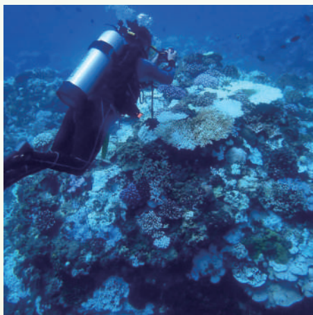
圖4：在海面下工作，拍攝珊瑚生態。

這個「珊瑚骨骼的細菌」一系列研究，從筆者念博士班開始，直到進入臺大服務，投入了整整十年的時光。這過程百感交集，困難重重卻也成就感非凡。因為這樣的研究要接觸到的技術包羅萬象，除了實驗室裡的分子生物學與微生物學實驗，接觸生物資訊分析的程式語言，為了能在海面下工作，也得學習潛水並取得執照（圖4、圖5）。在不同團隊合作時，如何將想法與不同背景的人溝通，是學問；怎麼與人協調，是藝術。珊瑚骨骼細菌的研究始於冷門，而今成為珊瑚共生體學的不可能被忽略的一