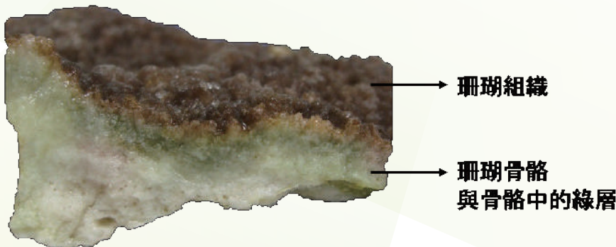
圖1：同孔珊瑚團塊剖面圖。圖中咖啡色部位為珊瑚組織，組織下方為珊瑚碳酸鈣骨骼，在骨骼內有綠色條帶狀的綠層。

筆者查閱前人用顯微鏡觀察的結果發現，珊瑚骨骼的綠層是來自絲狀的藻類或藍綠菌。牠們都是使用葉綠素（chlorophyll）進行光合作用來產生碳源的自營性微生物。然而，在2007年時，一研究團隊分析了珊瑚骨骼中的蛋白成分，發現了菌綠素（bacteriochlorophyll）的存在。菌綠素與葉綠素結構相似，存在在許多光合細菌中，這也意味著，還有別的光合細菌存在。只是很可惜，當時沒有任何相關資訊。於是，引起