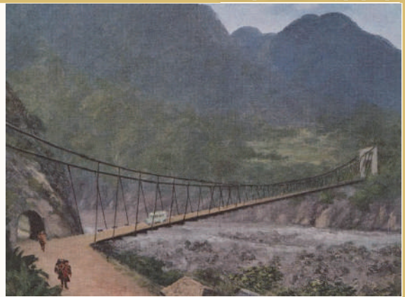
1939年攝，太魯閣立霧橋。