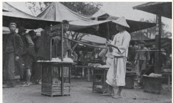
大稻埕，作為臺北市的漢人街，大稻埕的永樂町市場是臺灣人買賣最興盛的地方。衣服、食品、古董與日常用品等等的買賣都在以簡易搭蓬且並列的攤位上進行，叫賣聲、拉客用的胡弓月琴聲、中國戲劇的銅鑼唢吶吵雜聲，雜然喧囂到想要把耳朵摀住那般地興盛。