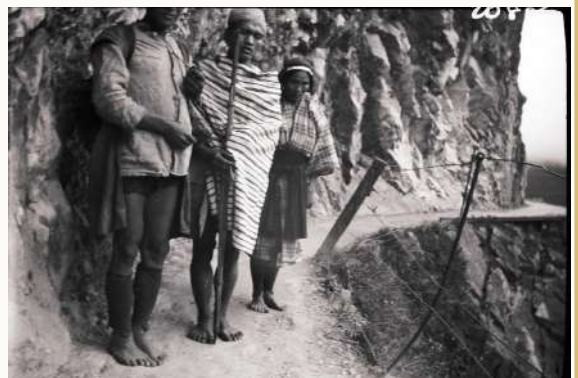
1938年，走在太魯閣峭壁的泰雅族人（今稱太魯閣族）