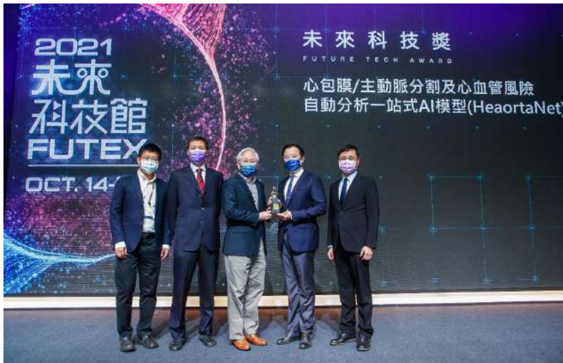
圖5：HeaortaNet獲2021科技部未來科技獎