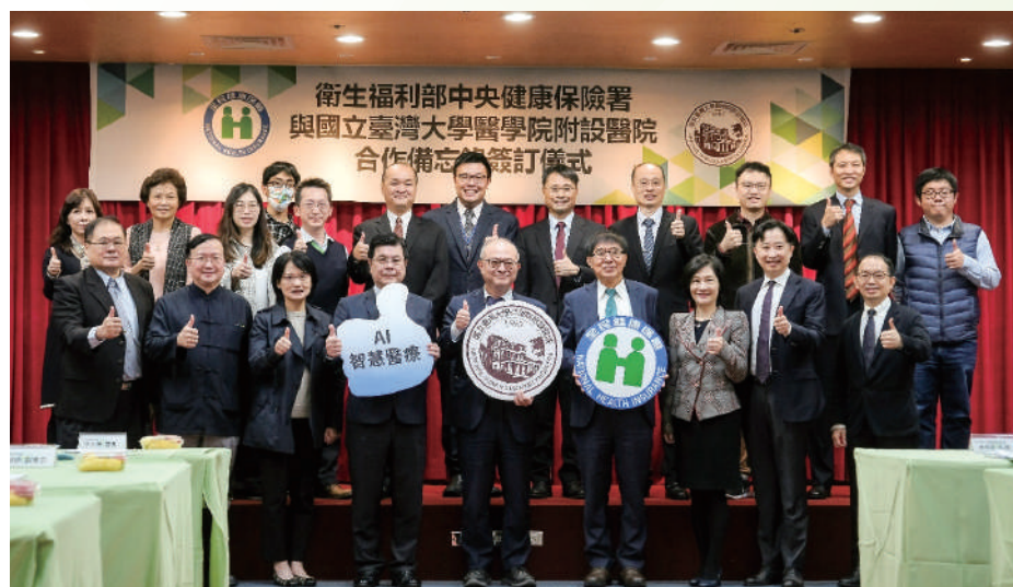
圖4：臺大醫院與中央健保署簽訂合作備忘錄

為全球唯一醫學機構自行開發AI模型獲選置於NGC者，目前日本大阪癌症研究中心、新加坡研究中心已有使用。2021年並在全國逾500件報名創新技術中，榮獲科技部「未來科技