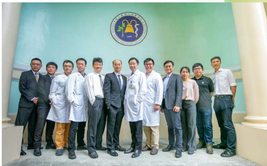
圖2：臺灣心血管人工智慧聯盟（Taiwan CVAI Consortium）團隊合照