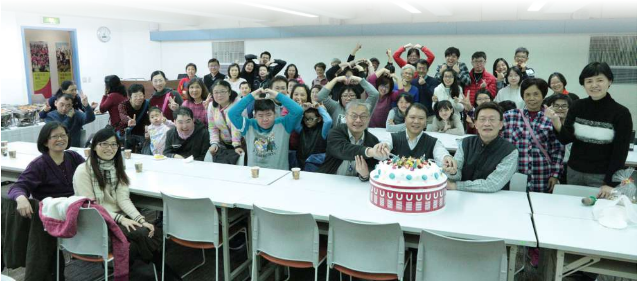
與罕病家庭聚會，謝教授是我們的大家長。

2006年1月15日協會成立當天，熟稔TSC的謝教授藉由媒體發聲，提出治療單位單一窗口的構想，希望透過媒體報導，讓國建署