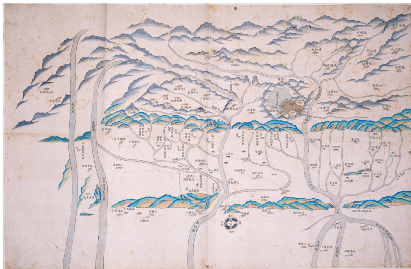
圖 7-2、彰化縣隘寮及生番社位置圖（乾隆二十二年）