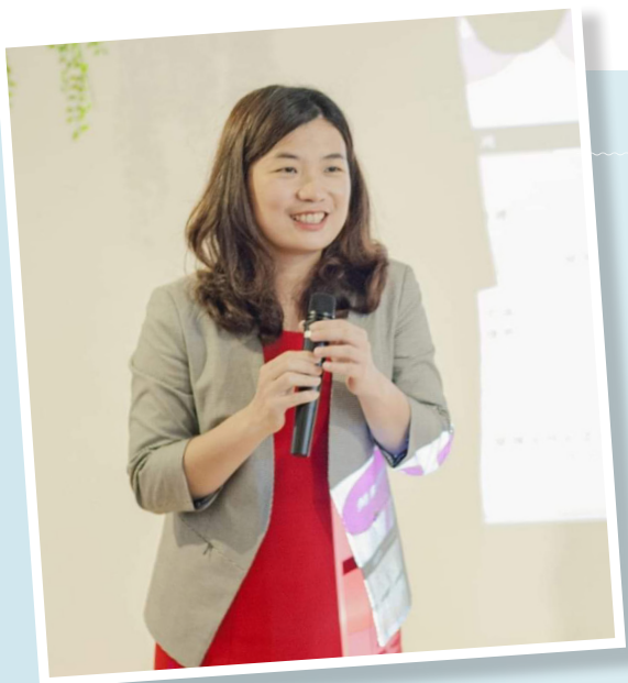
發展女性重回職場課程，積極從事社會倡議。