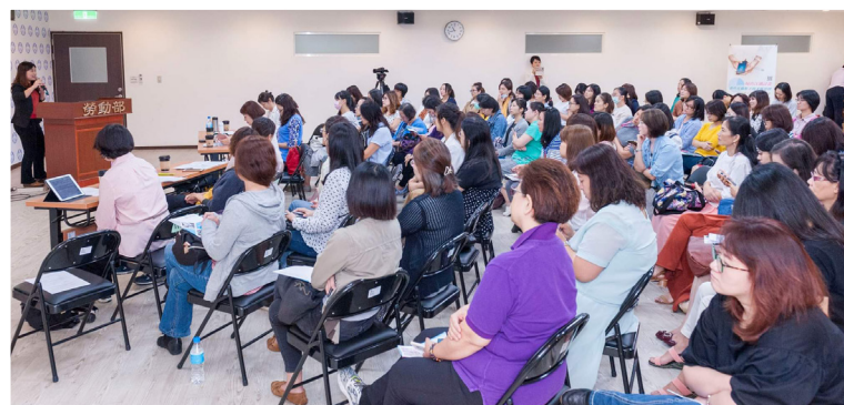
得人辦理勞動部婦出江湖計畫，支持女性重回職場。