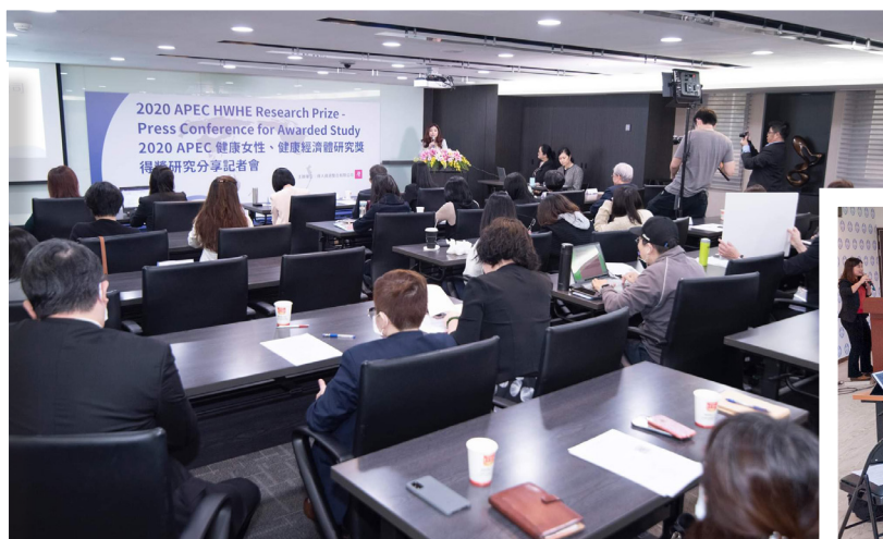
得人發展本土研究，進行社會倡議。

我們得到來自企業界、公部門、民間組織的許多協力跟幫助，當中有很大一部分來自臺大學長姊：我們過去不認識他們，而他們只單單因著認同理念，就盡力在自身位置及影響範圍支持我們。透過公私部門協力、企業與社企協力、學界與社企協力，我們在