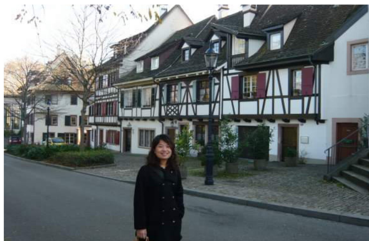
2009年負責華碩電腦瑞士市場，認識彈性工作。

2002年冬天，我加入了華碩電腦，前面四年在總部當產品經理，先後開發主機板、數位家庭產品；之後三年到歐洲業務部從事國際市場開發，先後負責瑞士、法國，當年讀的西洋中古史派上用場；之後三年到亞太區，做東南亞、日本、韓國的區域行銷經理。我非常幸運地，在年輕的時候，加入了一個快速成長中的臺灣公司，獲得好的歷練：承擔力、膽識、視野、執行力，都是在工作中鍛鍊的。先後在歐洲市場跟亞洲市場工作的跨文化經驗，塑造了我做為一個臺