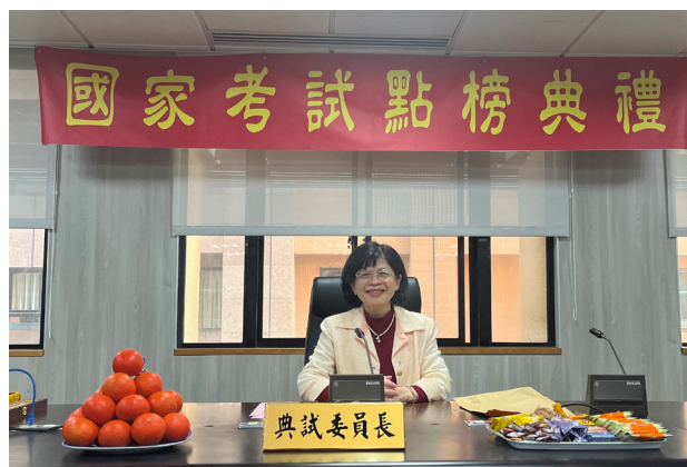
國家考試點榜典禮。

立了考試院，考試權獨立運作。考試院成立於民國19年，至今已逾90年。每項國家考試均由總統任命典試委員長主持，玉尺量才。考試分為兩大類：公務人員考試、專門職業及技術人員。國家選才制度多年以來屢有改革，從歷代科舉演變至當前國考制度，未來在政經社會變遷下是否會有改良工程，有待社會共識。