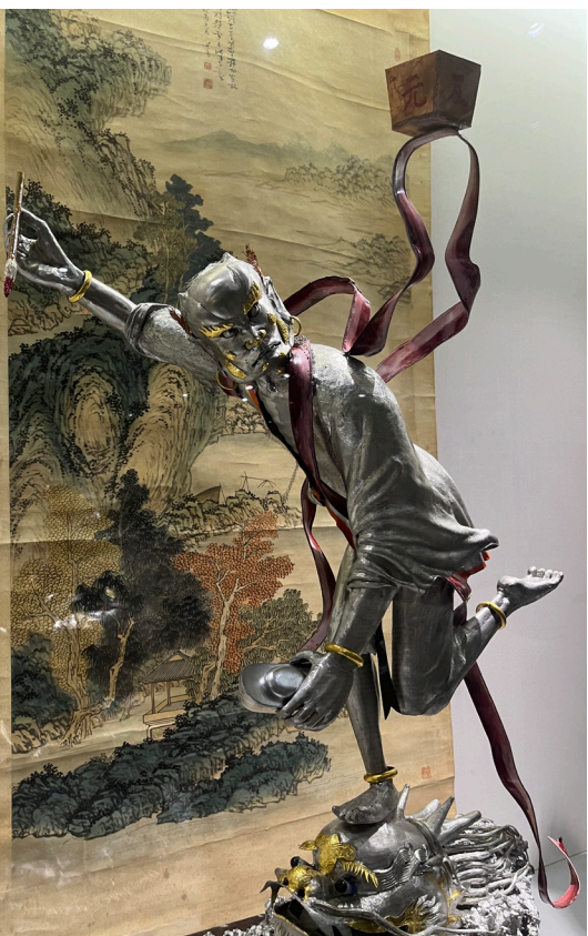
魁星踢斗（攝自鹿港民俗文物館）。

為國取才之道，傳承至今，在國父孫中山先生的五權分立理念下，強調權能區分與平衡，五權分立而相成，設