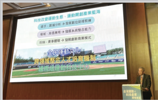
2021年11月30日我受邀在行政院召開的「臺灣運動×科技產業策略會議」進行主題演講，建議以科技推進全民運動文化的策略，進而展現運動文化的社會意義與產業價值。

是美國文化裡非常重要的元素。這裡運動泛指任何形式的體能活動（包含休閒、競技、遊戲等性質），目的是刻意發展身體活動能力以促進身心健康，同時也可以為參與者及觀眾創造娛樂效果。體育（體能教育）則是教學活動的一部分，多半在學校中實施，目的是協助學生鍛鍊身體以促進身心健康。如果是課程，通常是學