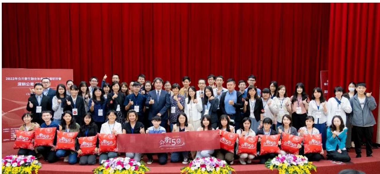
公共衛生學會50周年邀請公共衛生師與會共襄盛舉。

製藥公司、醫療器材公司、安全衛生管理顧問公司、臨床試驗受託機構、高科技製造業等公務人員、研究人員、教學研究、健康管理專業人員、資料分析專業人員、職業安全衛生專業人員、環保與風險評估專業人員等。相較於社工師、律師、會計師、營養師等專業證照，公共衛生師主張專業不專屬，但外界較不熟悉公共衛生師之專業定位與角色，現階段臺灣公共衛生學會除了衛福部計畫，也透過「國衛院論壇-臺灣公共衛生師專業發展與人力規劃」專書之撰寫與專題研討會議，逐步推廣國內公共衛生師專業。於推廣專業公共衛生師之計畫中，學會邀請產、官、學各界專家學者共同研議人力之發展，藉此讓各界進一步熟悉公共衛生師之專業內涵及其重要性。公共衛生師專業人力之佈署，不但能提升國內健康安全水平，更能創造公共衛生專業價值，促進公共衛生專業人力之職涯發展，未來將持續修訂相關法規，以促進公共衛生師之職涯發展，保障其永續工作權利，並讓各界更瞭解聘僱專業公共衛生師之重要性與必要性。