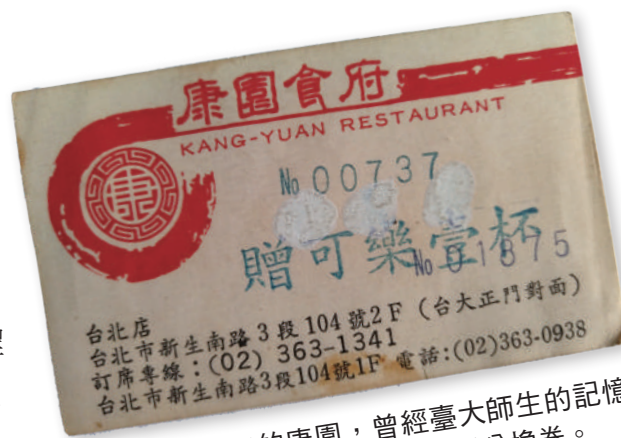
位於臺大正門口的康園，曾經臺大師生的記憶，我自己保存的一張1991左右的可樂兌換卷。