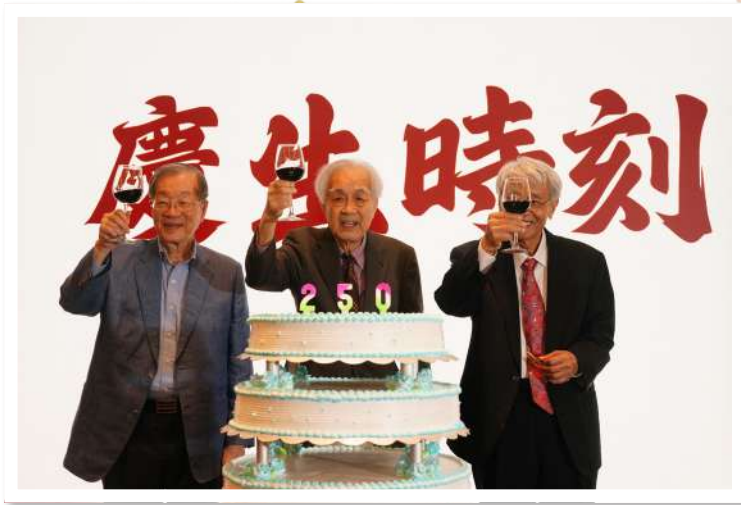
臺大心理系在4月11日為三位老師舉行「250聯合壽宴」。圖為三位老師一起舉杯與師生同慶。