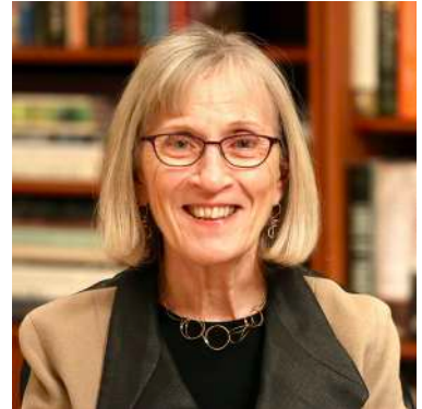
哈佛大學經濟學教授Claudia Goldin，2021年出版《事業與家庭》，針對美國百年來受過高等教育的婦女的研究。

從這個角度來看，我們的外婆，或是我們的媽媽，她們或許曾經工作過、或是人生一直在工作，但若她們的工作是為了養家活口，而不是為了自己、做自己想要做的事，那麼她們就不是在創造自己的事業。而我們這一代的女性，有幸在幾代奮鬥的基礎下，追求自己的事業，而