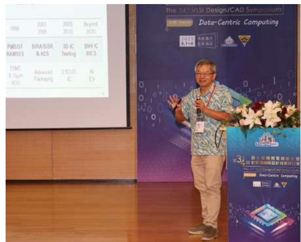
在高雄同一個演講廳，10年前我談的是為什麼學生不念博士班，這次的重點則是我對未來大學的期待。

在大學裡，學生的學習與生涯發展目標不相容於教授的生涯發展目標是一個嚴重的問題，大學應該深切反省，提出改善之道。大學既然要求自治，不應該被動期待外界（政府）來解決自身問題。教授本身不適合從事教職的狀況毋庸贅言，但如果是人事相關系統不利於教授指導學生達成他們的學習目標，教授應該合力改善該系統，這才是大學自治的精髓。如果教授們放任這個問題一直拖延無力解決，除非是政府干預，違反憲法學術自由的保障，否則就只能自己承認臺灣的學術界水準如此而已，開創未來造福人類的能力不足，也難以期待培育出本土的諾貝爾獎得主了。我今年2月1日從清華大學退休，退休前雖然長期兼任行政工作，但是指導博士