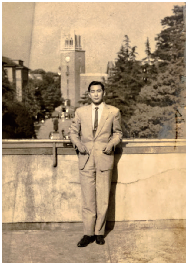
追隨父親的腳蹤到日本早稻田大學讀研究所。攝於早稻田大學校園。

我的人生可以用一句話來形容：So many “if” in my life. 看似缺乏奮鬥目標，不盡符合社會的價值觀，卻也因此不設限，能把握機會，走出和當時代同儕不一樣的人生。