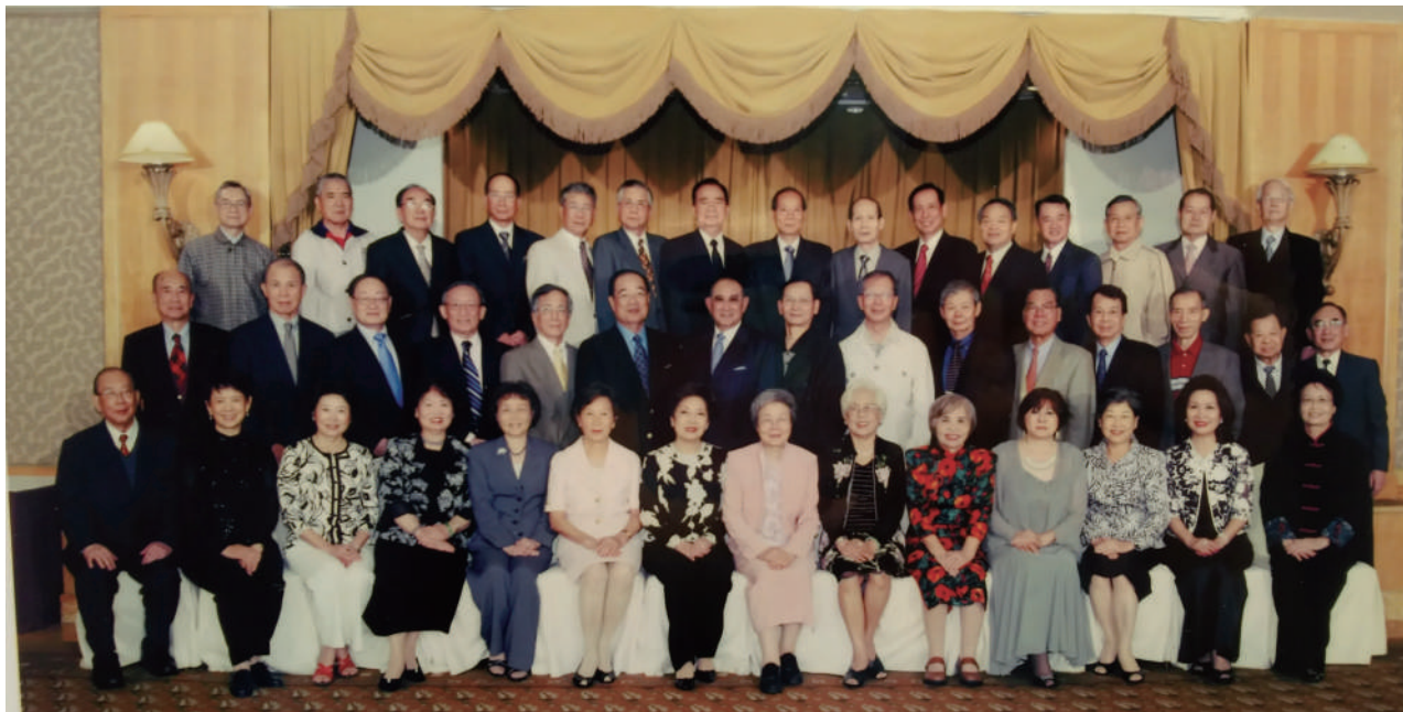
2008年經濟系畢業50周年同學會。

件事，導致我畢業後轉赴美國讀書工作十多年。1962年我被拱出來參選留日中國學生會長，當時會長都是由大使館推派國民黨員擔任，拱我的後來都成了臺獨分子，但我不是國民黨員，更不是臺獨分子。選舉很激烈，結果我們勝選，這讓我們壯膽。第一次開幹部會議時，大使館文化參事不請自來列席指導，我把他趕了出去。事後才驚覺”慘了”，不敢回來，又不能待在日本（那時代日本公司不聘外國人），畢業後要去哪？那就去美國？先在紐約讀語言學校再申請大學，只要學校給我獎學金我就念。那時臺灣的國民所得一年400元美金，美金和台幣1比40（我當兵前曾短期在彰銀工作，一個月薪水900元新台幣），父親不可能提供我高額學費，所以我只跟父親拿500美金買機票，後來他又給我1800美金當生活費，但單單保證金就要2400元，所以我向比我先到美國的表姐