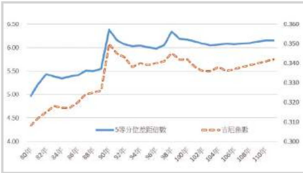
圖1為臺灣歷年來所得5等分位差距倍數以及吉尼係數，年年有高有低，兩者變動趨勢接近，在90年所得分配不均度達到最高，次為98年度，其他年度較低，自105年以來有逐步上升趨勢。