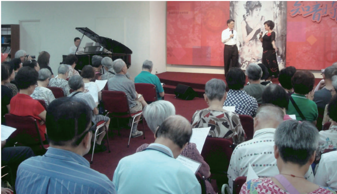
2013年8月28日在社教館舉行的「知音時間」定期演出，一樓大廳坐滿一定來捧場的銀髮粉絲。

齡學員學習和挑戰的機會，自信心、自尊心就在這以人為本的教學中建立起來。學員們在自主管理中保持自信幹練，在公開演唱中維持外表亮麗，在不斷的新歌學習中鍛煉頭腦靈活身心。「重相逢」從結合休閒娛樂與終生學習，延伸至日常生活的相互扶持，是高齡人口音樂活動極為成功的範例。