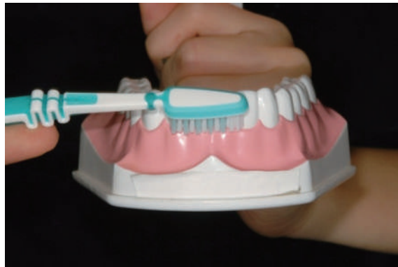
正確的刷牙示範：牙刷刷毛朝牙齦方向，上牙朝上，下牙朝下（左），與牙齒的縱軸呈45度角置入牙齦溝內（右）。