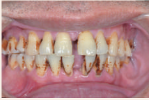
牙周病治療前。