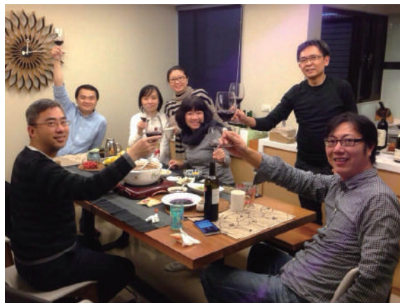
臺大4年，是我人生學習的黃金期，也結交了可以是一輩子的好友，願我們每個人活出精采的生命，乾杯！