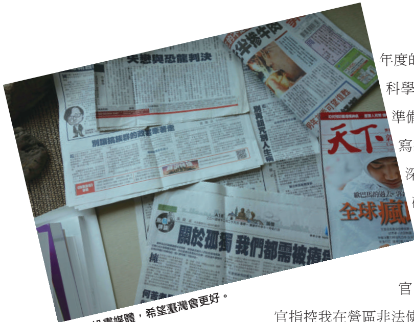
寫文章投書媒體，希望臺灣會更好。

年度的國科會研究創作獎。這個意外又燃起了我對科學研究的一絲興趣，就開始去考GRE及托福，準備當兵後出國唸書。那時候王院士還說要幫我寫推薦信到美國他的得意門生哪兒去讓我繼續深造，而那位得意門生就是後來回臺灣接掌中研院的翁啟惠院長。