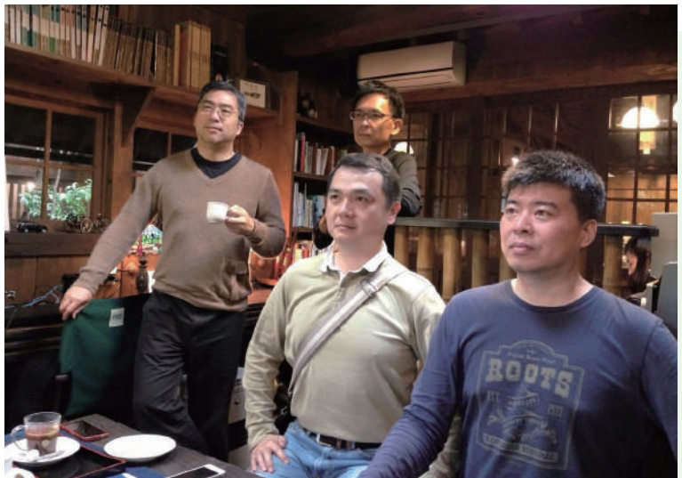
臺大F4，我在左1。(日北九州黑川溫泉)