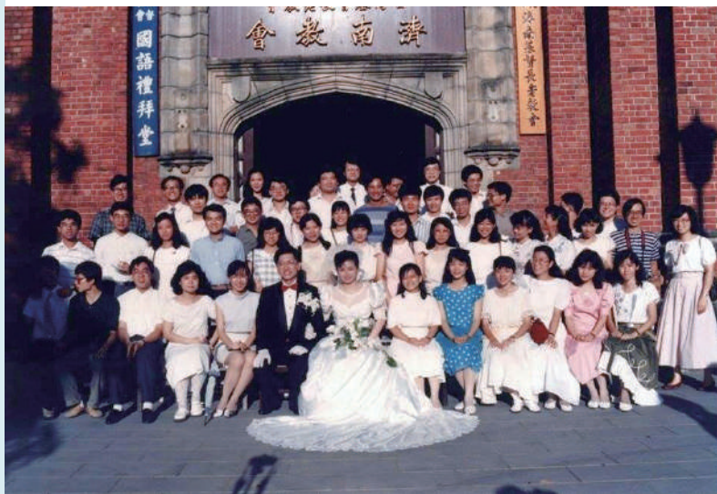
大學時團契契友結婚大合照，臺北濟南教會。