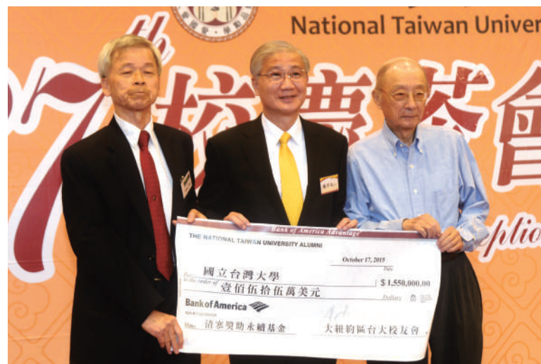
大紐約區臺大校友會於校慶日返母校捐贈清寒獎助學金。