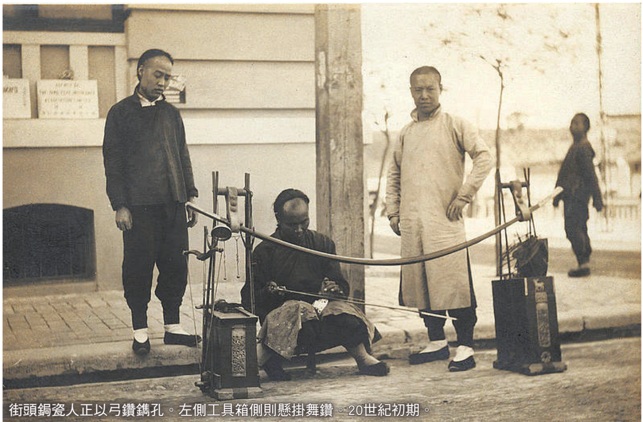
街頭銅瓷人正以弓鑽鑄孔。左側工具箱側則懸掛舞鑽。20世紀初期。

以濕潤的黏土塑形，過火加熱燒結，是人類將柔軟的黏土經由化學變化轉變成堅固陶器的重要發明。陶器沒有單一的起源，世界上絕大多數的古代住民都懂得製作陶器。從考古學資料看來，易碎的陶器不符合純粹游牧民族的經濟效益，所以多是在人類定居生活後始普遍製作，也因此被視為是仰賴狩獵、漁撈或植物