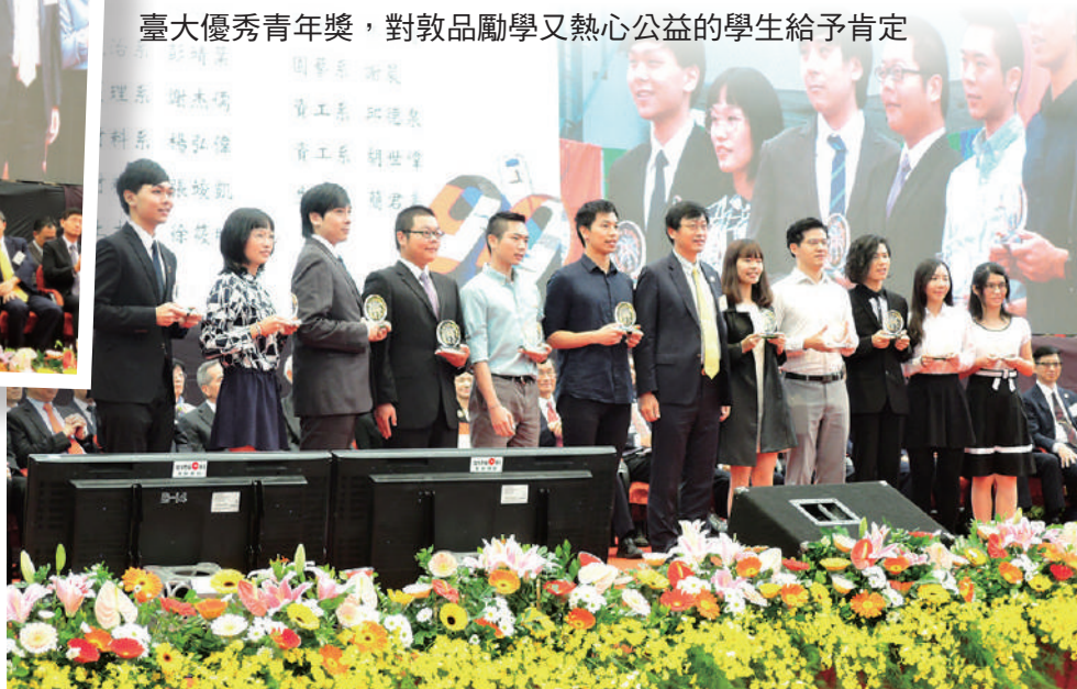
臺大優秀青年獎，對敦品勵學又熱心公益的學生給予肯定