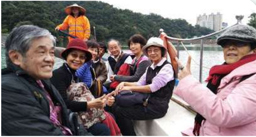
來到碧潭搭人力擺渡。

覺。上了岸，順著「水岸街坊」逛商店街，與愛神丘比特裝置藝術合影，頗有到歐洲河岸的Fu。