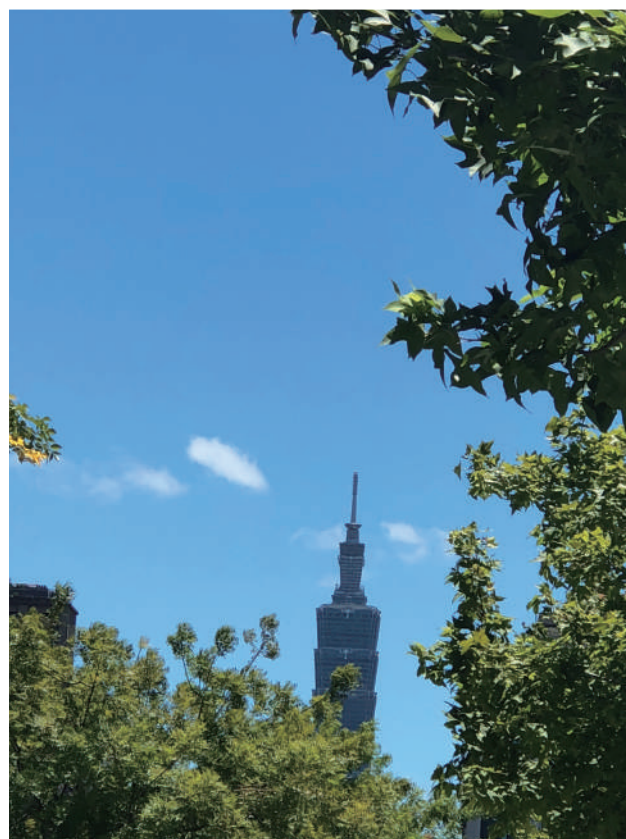
<台北的天空>，充滿夢想與希望。