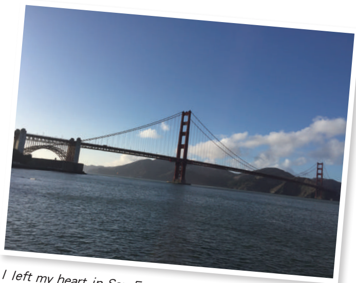
I left my heart in San Francisco ，我心之所繫的舊金山，膾炙人口的名曲。