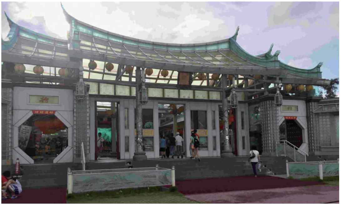
古都鹿港，玻璃媽祖廟。

<台北的天空>——（有我年輕的笑容，還有我們休息和共享的角落）訴說人們成長足跡，敲動每個人的心坎，讓繁華的台北街巷繪上深刻的思緒。