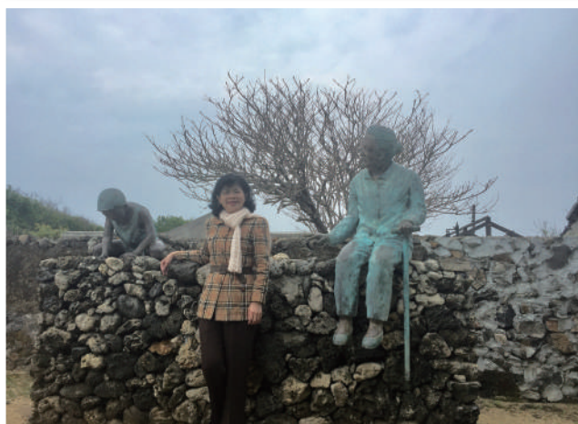
<外婆的澎湖灣>作者潘安邦舊居。