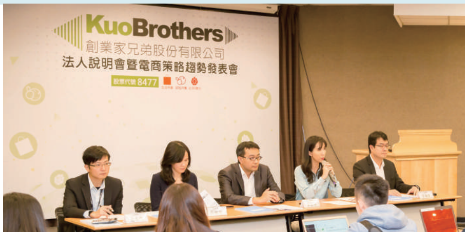
創業家兄弟（8477）創臺灣最快上櫃電商紀錄。圖為法說會。

搬回家，我想這樣我就可以自修，不用花錢去補習。第二天，我看到垃圾堆又有新的參考書正要搬，鄰居大姊姊看到，