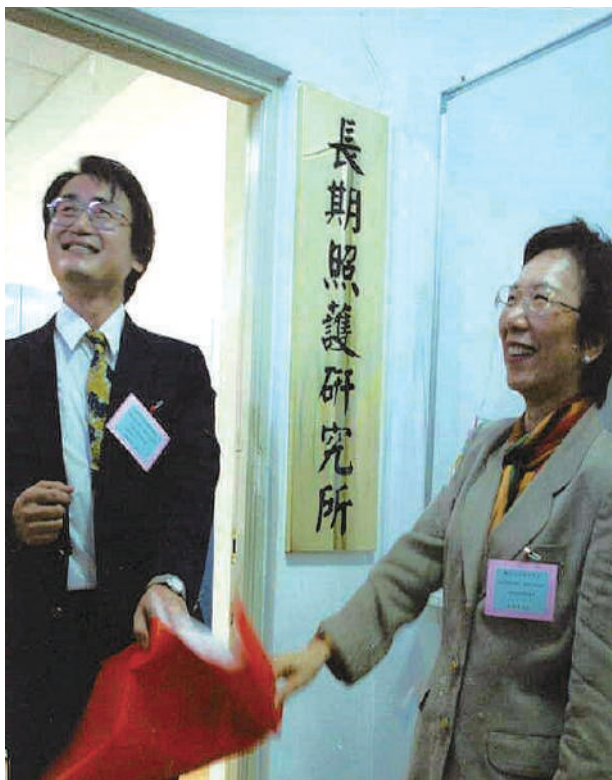
2000年受聘至臺北護理健康大學肇建國內第一所長期照護研究所。

我是臺大醫學系第九屆畢業生，1975年入學，從踏出校門起算醫界生涯已37年，在醫療、保健、公衛、照護等臨床、教學、研究及政策等場域都有所涉略，甚至差點入朝擔任不大不小的芝麻官。