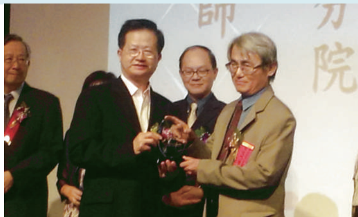
2016年榮獲臺北市醫師公會杏林獎。

人類自古問題多雜，又以生活及健康問題為大宗。然而，生活中隱含著健康問題，健康中隱含著生活問題。先有『醫療』照顧，再『養護(social care)』、『保育(child care)』，再合併『支持、保護』之『照護(custodial care)』。健康消極面之求取安適，再轉積極面之生活參與(WHO, 1948, 1984, 1999; IOM, 1986)。『長期照護』所論包括人口結構高齡化、少子化及人口全減縮化；疾病型態慢性化、持久難癒化；健康問題障礙化、失能依賴化；照護內容複雜化、多元多層化；照護時間長期化、掏空耗竭化；獨居老人比例之增加；高危險群與弱勢之分佈