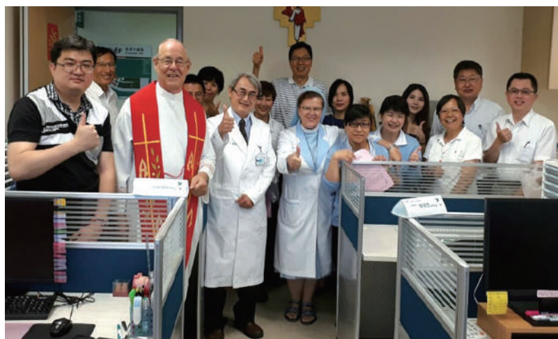
退休後轉進輔仁大學醫院、醫學系服務。