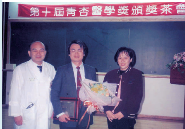
1999年榮獲臺大第十屆青杏醫學獎。