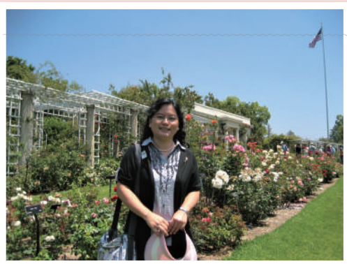
作者攝於最愛的杭廷頓玫瑰園。