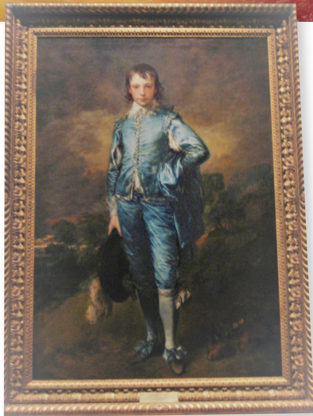
杭廷頓館藏美術作品“ The Blue Boy ”。

去到中國館，順便也遊覽了流芳園。進入展場，發現展品精緻而多樣，譬如翁同龢的「虎」字書法，以直立式玻璃櫃的方式吊掛，觀眾可以貼近玻璃去看個仔細，果真像隻大老虎匍伏於地，氣勢渾圓。而王翬的「長江萬里圖」則以平台式陳列，由右自左巡禮，有如搭乘遊船，飽覽長江風情。來美國卻看了中國書畫展，也算是意外的收穫。