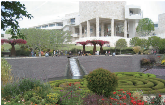
蓋提博物館中央花園的泉水引流至地面的花園。