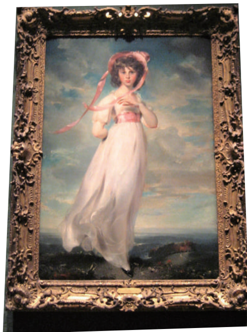
Thomas Lawrence的畫作“ Sarah Barrett Moulton: Pinkie ”為杭廷頓圖書館重要典藏。