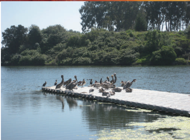
聖塔芭芭拉加州大學（UCSB）校園邊上的潟湖，湖邊常有鵝鴨群聚。