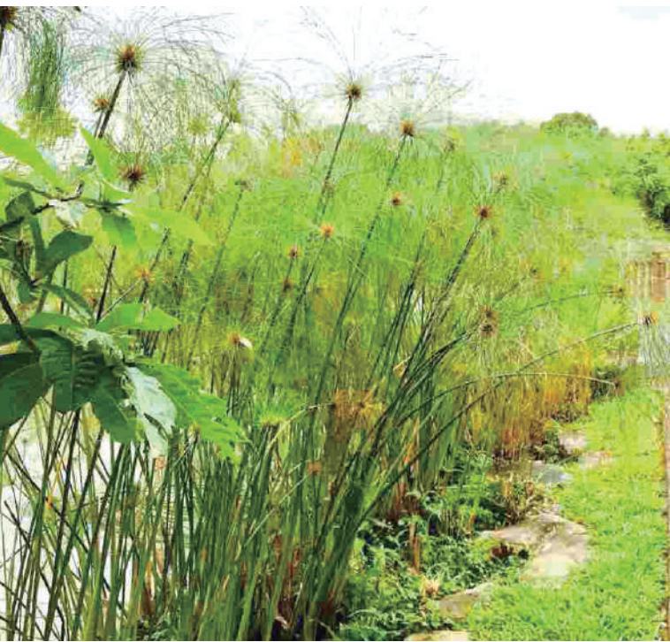
醉月湖邊。（2020/05/20, 16:35 pm）