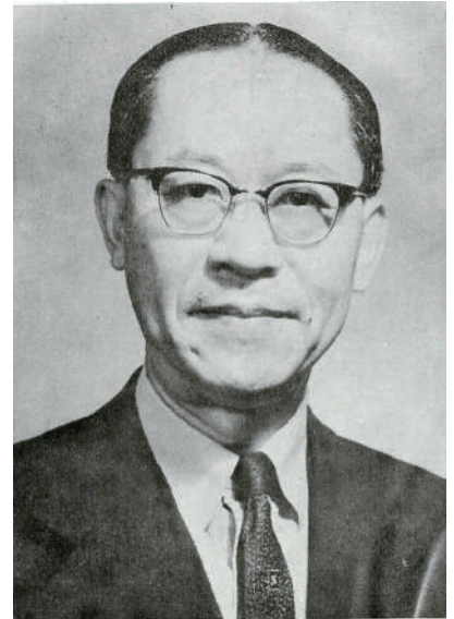
方東美教授

從這些課程中看得出來，它們大多屬於歐陸哲學，這也說明臺大哲學系的課程規劃，在一開始就維持歐陸教育的特徵。雖然如此，在上世紀5、60年代時，哲學講求博大精深，東、西方哲學的區分並非主流，融合才是趨勢。例如說，方東美先生在中國哲學與佛教哲學上造詣很深，但他對於希臘哲學，尤其是柏拉圖的哲學有深入的見解。黃振華先生留學德國，專門研究康德的哲學，但對於融合康德哲學於中國哲學方