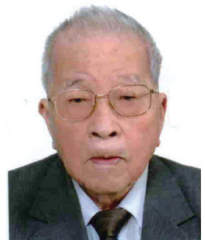
曾天從教授