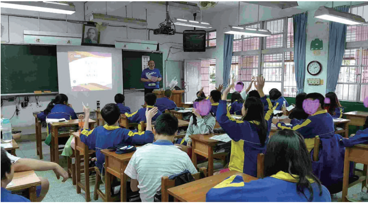
臺灣中學生在國際教育成果評量PISA的結果顯示是全世界最「害怕失敗」的中學生。

發，轉化出有實證基礎的調心舒壓技術或教學課程，也不乏相關研究中心的設立。反觀臺灣，似乎都以個人問題或失常來看待，視為醫療問題。然而這已是一個普遍現象，應當視為一個教育甚或社會問題，需要放在教育的脈絡下來預防與調整。