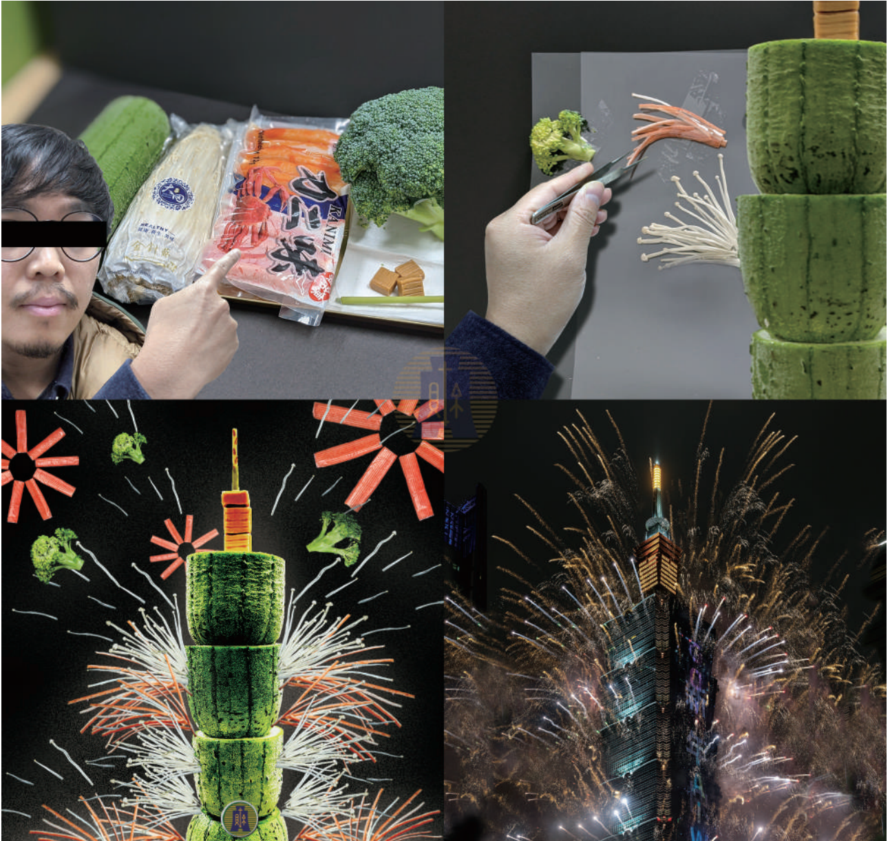
2020公部門在社群經營展現前所未有的活力和創意，引起社會大眾共鳴，讓政策達到溝通的效果。圖為財政部FB#新年在家篇。

亞馬遜（Amazon）旗下的Mechanical Turk（MTurk，「土耳其機器人」）。「土耳其機器人」的典故源於18世紀流行於西歐地區，穿著土耳其服飾，會與人下棋的機器人。它們雖然號稱機器人，實際上卻是由真人在背後操縱。據估計，全球Amazon MTurk上活躍的MTurkers超過兩萬人次/每月，工作