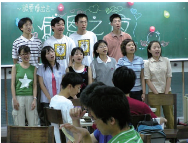
臺大福智青年社感恩月卡片傳恩情活動（2004）。

此外，大三開始的實驗室專題研究學習分析問題、尋找及嘗試解決方法、分析階段性結果，這過程讓我覺得很有趣，像是一連串解答邏輯推理問題與過關打怪的過程，