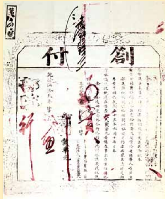
清代義民劄付。

關，也對應著清帝國的地方控治及華南的商貿活動和經濟發展。研究清代「客家」移民定居的歷史，有助於瞭解清代臺灣社會整體發展的歷史。■