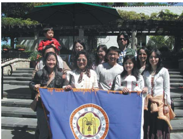
■ 參與達福臺大校友會服務校友，2007年獲選為會長（前排左2）。

整排小店，像博士書店，4、5坪的店面雖小，但萬物具備，應有盡有，還有山東鍋貼及冰果室也都是我們住宿生常光顧的店，另外天橋對面的得記和偉多利麵包店、鳳城的招牌飯、新生南路的大聲公，以及舟山路旁的意麵攤，都是我常去打牙祭的地方。週末，學生活動中心常有免費電影，第二輪電影在東南亞放映只要幾塊錢。當時的校園非常幽靜，三五好友坐在杜鵑花叢裡談天說地，是很大的享受。與男友約會就從椰林大道漫步到醉月湖邊，足跡踏遍校園的每一個角落，而動物館旁的寧靜小道也是情侶出雙入對的地方。當時宿舍沒有電話，男生要找女生，只能在宿舍外面站崗，再請要進宿舍的女生幫忙喊外找，被約找的女生又是羞澀、又是驚喜出來相迎，這種約會方式很純真，也很耐人尋味。那時宿舍11:30就關門，有一次去西門町看電影回來時已關門大吉，只好攀牆而入，如今回想起來，別有一番情趣。