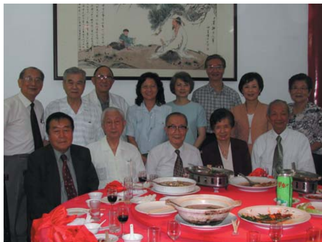
■多年前返國回母校時，筆者（後排左4）有幸與前校長虞兆中教授聚餐。

臺大出國風氣盛，「來來來，來台大，去去去，去美國」是6、70年代在臺大流行的口頭禪。畢業後在臺灣教書兩年，也隨波逐流到美國求學，開始人生另外一個旅程。我一向對教育工作充滿熱忱，所以選擇教育心理作為研究所研讀課程，學海無涯，人生處處皆學問，窮其一生都學不完。