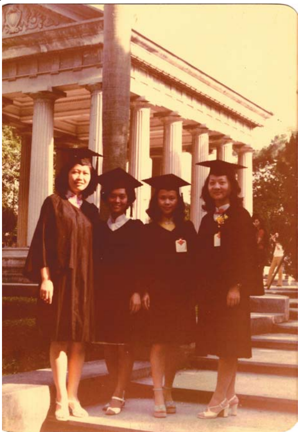
■筆者（右1）大學畢業時，與室友於傳園合影留念。

都應邀來參加，他們的音容絲毫未變，只是頭髮白了些許，「一日為師，終身為父」，他們令人又敬又愛。