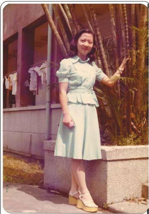
■ 筆者攝於臺大女三宿舍。