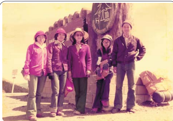
■ 社團活動豐富了我們的大學生活，也學習到許多寶貴的待人處世之道。

我們班雖大，但是每逢班際競賽活動，像歌唱、划船、園遊會等，大家可都精誠團結，全力以赴。還有一年一度外語劇院公演時，爲了把莎士比亞及西洋名劇介紹給全校，更是全班總動員，群策群力把它辦好，觀眾出席人數年年增加，老師們花費多時指導，功不可沒。在我們畢業二十年的同學會中，王文興教授與林耀福教授