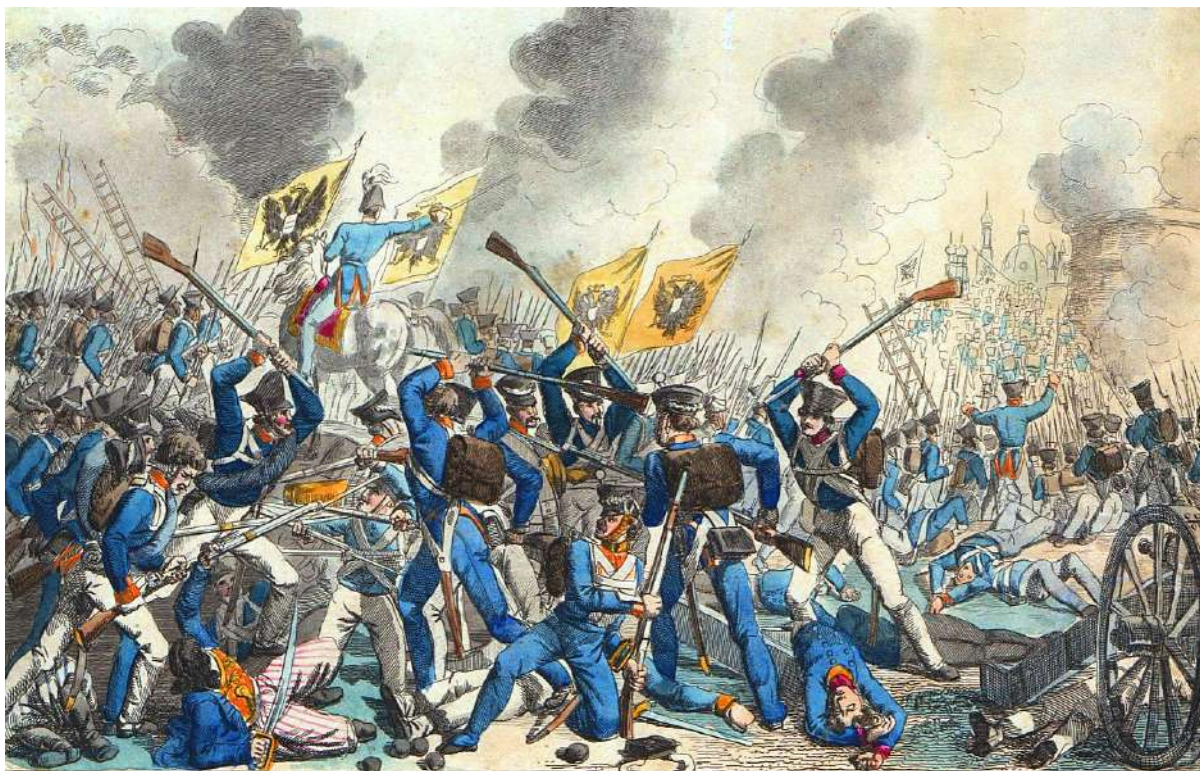
俄羅斯帝國攻擊華沙，激發蕭邦創作「革命練習曲」。圖為Georg Benedikt Wunder作品：The assault of Warsaw on 7th September 1831，取自維基百科。

2002年電影《戰地琴人》（The Pianist），獲得法國坎城影展最高榮譽金棕櫚獎，奪得三項奧斯卡大獎。取材來自波蘭猶太作曲家兼鋼琴家史匹曼（W. Szpilman）的回憶錄，