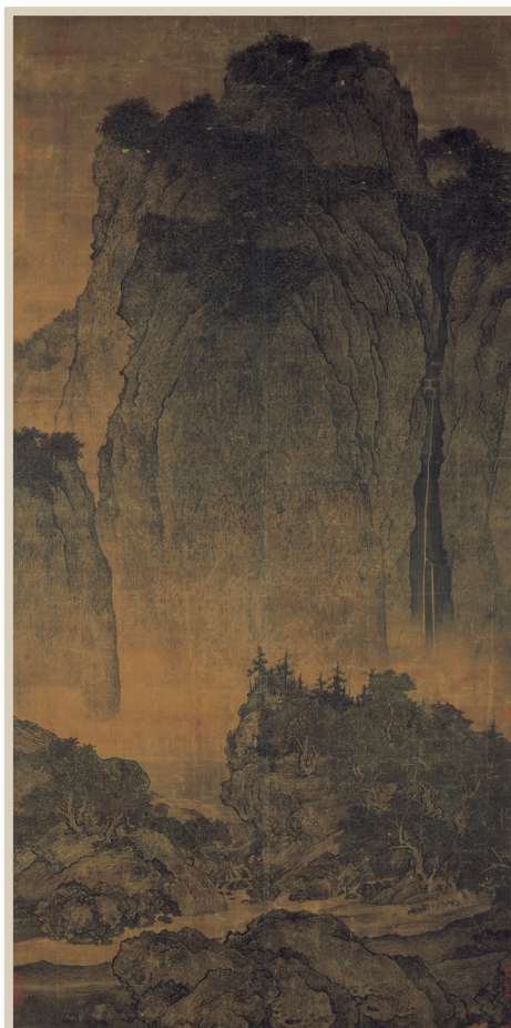
圖2：范寬的畫作《嶽山行旅圖》