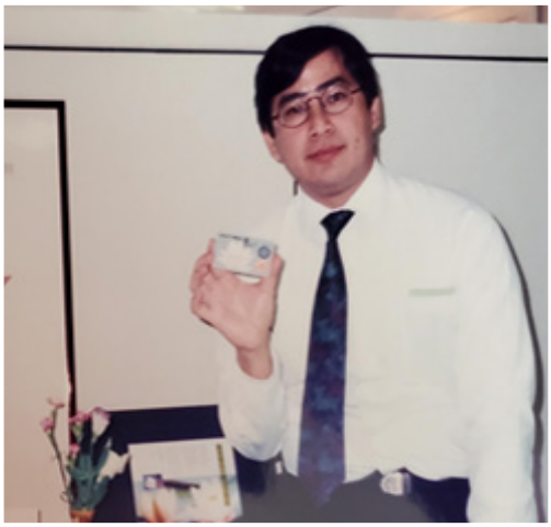
設計「蓮花卡」，讓慈善和金融相得益彰。