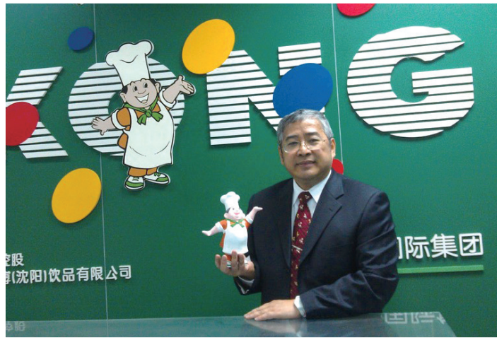
擔任頂新集團的講師，有「康師傅的師父」的雅號。

的好部屬、老闆眼中的好員工。我也是「慈濟蓮花卡」的設計人，讓金融與慈善能共相結合，相得益彰。