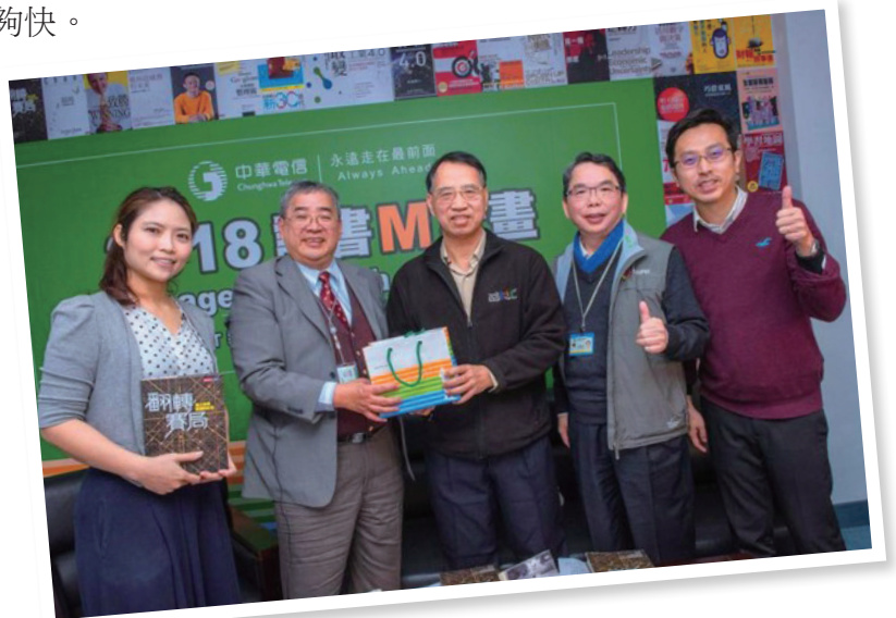
2018 讀書M計劃，1周1書直播52次。