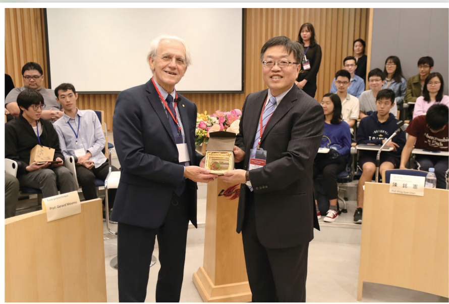
致贈紀念品予諾貝爾物理獎得主Prof. Gérard Mourou 感謝其蒞臨演講。

我想大家都了解，要成為世界一流的大學，必得加強國際化，包含建構一個對國際生友善的環境，課程的國際化以及研究的國際化。課程國際化之具體措施為國際師資之