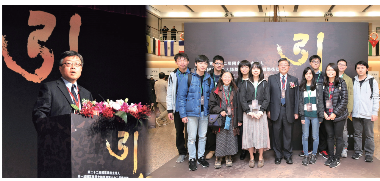
現任臺大副校長，於第22屆教育部國家講座主持人頒獎典禮領獎並致詞。

許多人都有所謂的勵志箴言。而我，常援以自勉的是「做一個務實的理想主義者」，字面上意為秉持理想，正視困難，務實地解決問題、達成目標。然而，這座右銘給我的真正幫忙是提醒自己瞭解客觀條件，體會別人的處境，用同理心去處理事情。