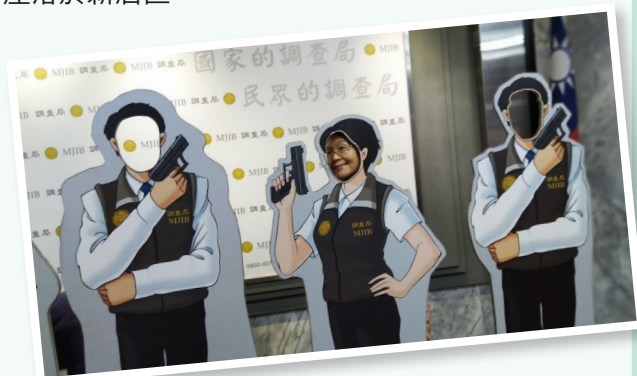
筆者在人型立牌照像。

我們從捷運新店區公所站步行前往，不過5分鐘就到了，耳邊聽到有人說：「啊哈！我以前常從這條路進進出出，卻從沒注意到調查局就在這兒……」可見其建築本身並不起眼。進去後，由季科長親切接待，為我們介紹調查局業務，攸關國家安全與社會安寧。看完影片後，再分組參觀反毒陳展館、展抱館，與鑑識科學處等，對我而言，這是從未有過的新鮮體驗：看到一座精雕細琢的吸鴉片床，想像當年王