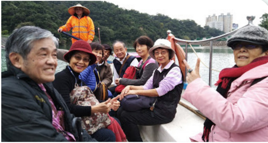
來到碧潭搭人力擺渡。

覺。上了岸，順著「水岸街坊」逛商店街，與愛神丘比特裝置藝術合影，頗有到歐洲河岸的Fu。