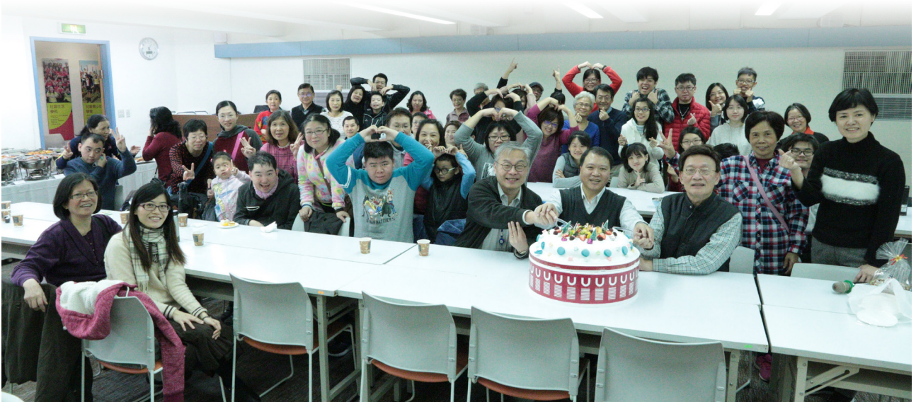
與罕病家庭聚會，謝教授是我們的大家長。

2006年1月15日協會成立當天，熟稔TSC的謝教授藉由媒體發聲，提出治療單位單一窗口的構想，希望透過媒體報導，讓國建署