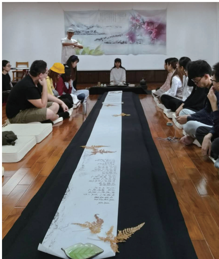
仿蘭亭之會「曲水流觴」，以吟詩或朗誦來佐茶。