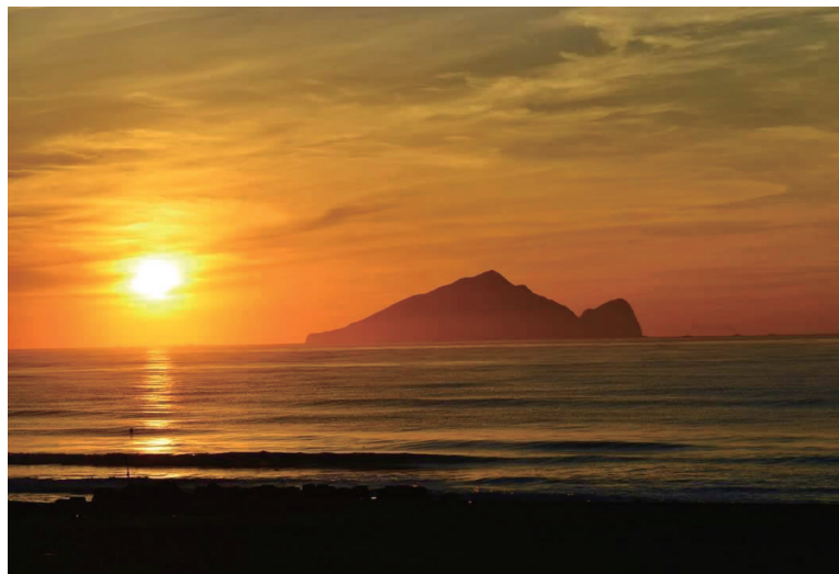
遠眺龜山，四時俱異。圖為「龜山朝日」勝景。