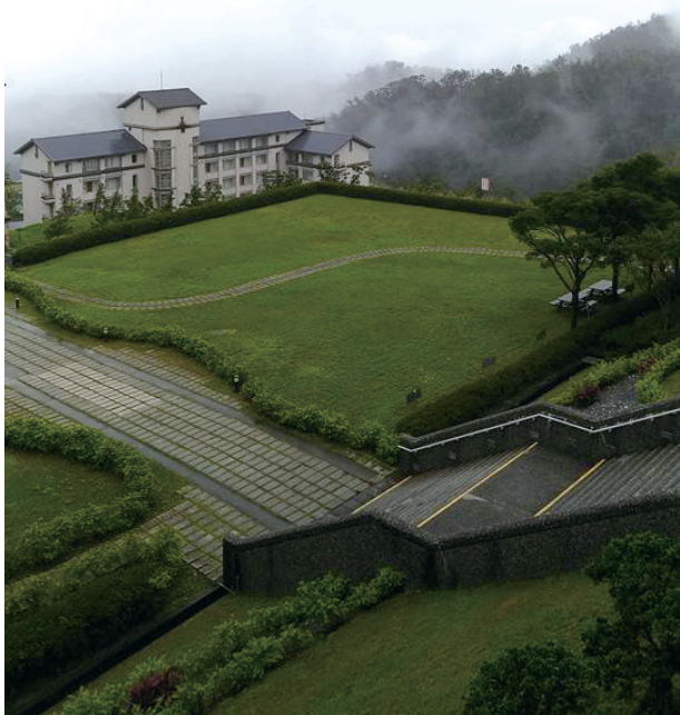
從臺大退休後隱居林美山上，樓在山中。

今晨太陽曬到我的尻瘡（臺語），六點半山上的秋陽已炙熱，透過虛掩的落地窗簾縫隙，灑入窗前地板，還爬上床沿，溫暖的秋陽正好不偏不倚，溫柔地撫摸著我的屁股。我想起臺語的俗諺「困尬日頭曝尻瘡」，不覺莞爾。這句俗諺是兒時長輩喚我起床的用語，有斥罵我貪睡的意味兒；今天