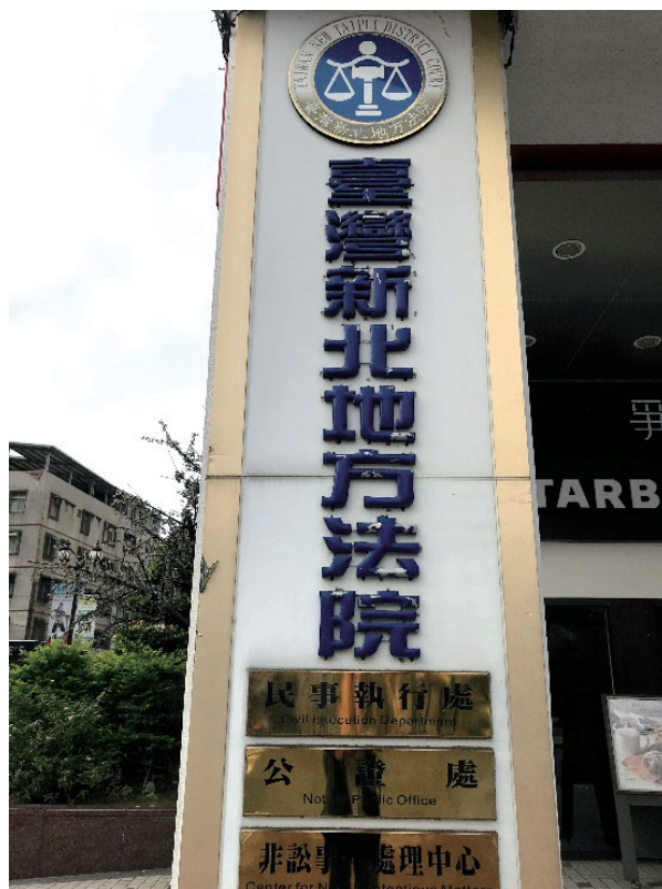
各地地方法院均設有公證處，圖為臺灣新北地方法院公證處之所在地。

而所謂「認證」，則是針對民眾所提出的公文書（例如：戶籍謄本、戶政核發之結婚證書）、私文書（例如：契約、聲明書）、翻譯本或繕影本，證明該等文書確實由民眾或有權機關所做成，其上之簽名蓋章為真正，或該等文書的原本與正本確實相符。以利民眾使用此文書時，能具有法律上的公信力。在實務上，若文書欲於國外使用（例如：辦理留學、國外居留、入籍等事宜），多數外國機關要求文書必須經國內公證