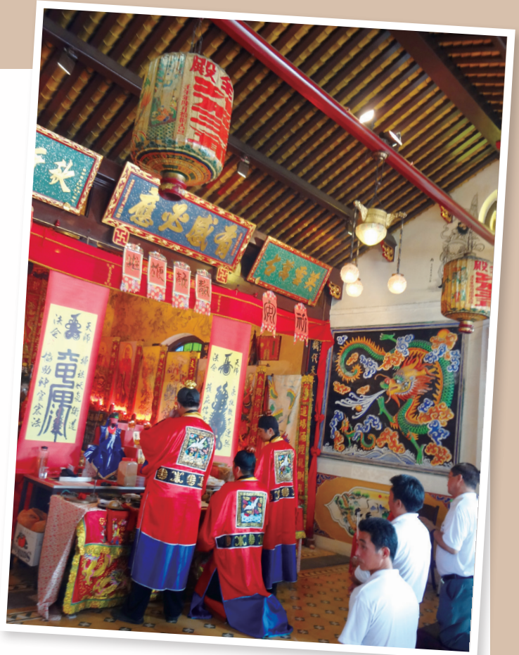
馬六甲勇全殿近年來恢復迎送王爺活動，2012年「清醮」醮典舉行時在正殿搭壇，道士團乃由麻坡道士所組成，其性質兼融王醮與清醮於一，反映出現今醮典的當代特色。