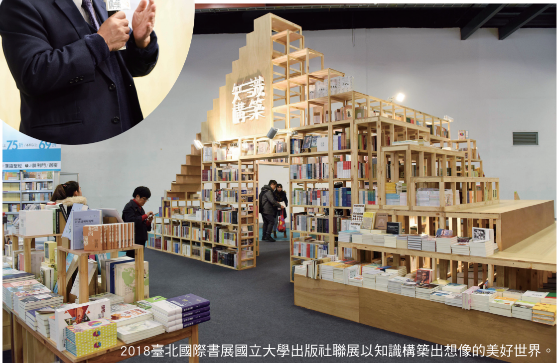
2018臺北國際書展國立大學出版社聯展以知識構築出想像的美好世界。