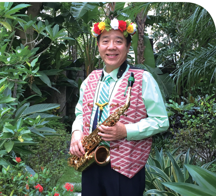
作為人類學家，因著研究和原住民朋友相交相知，投注畢生心力於族群變遷研究。

七大運動表面上似乎顯性易懂，但，仔細探究之後，不難發現其中的複雜性。例如，八十年代的「泛群」運動（即泛原住民運動），在進入21世紀之時，即見很明顯之「去泛群」思維的出現。換句話說，以族群政治運動為例，建置了泛群國家機構（即行政院原住民族委員會）之後，我們很快就看到了各族領袖，在正式或非正式場合裡，紛紛提出「去泛群」或「我族化」的訴求。此等現象在文學建構、族稱獨立運動及重掌環境運動中，也相當明顯。因此，除了廣泛描述各個運動主體面貌景況外，筆者亦會謹慎地處理每一細膩層面的動態內容。總之，前臺是風光，也是原住民四百年來，或更精確地說，即在全面接納外來統治或被完全征服後的一個世紀當下時空裡，所出現之前所未有的自信主位與前瞻行動。這幾個層面的社會運動，當然有其相互串聯交互作用的機會，那種引爆的動能，會是一大衝力。去年（2016），總統履行向原住民道歉儀式，即