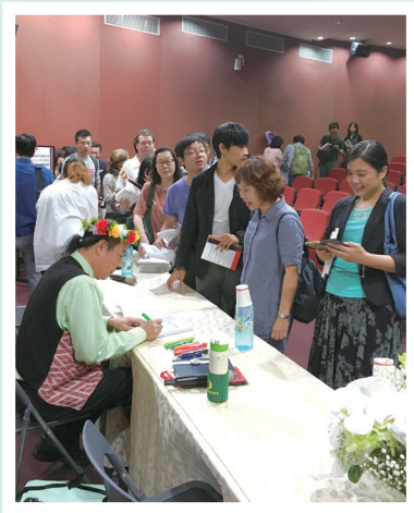
10月15日新書發表會後簽書

但是，人是活的，腦筋細胞隨時奔跳飛躍，硬是有人不願就此服輸。會服輸的話，就不可能原住民大小朋友一下子就使《認同的污名》臺灣紙貴。這表示，不少人早已經內心燃火，一本契合心思的書，足以成為眾志成城力量推手之一。現在新書上市，距離前書已是唸完七個大學畢業以後的今日，大量原民知識青年正在各角落努力不懈，他們或許是自灰燼中重燃火苗之後的烈焰主角，養足了精力，承接著後《認同的污名》時代各類舊新挑戰。 [圖] (本文為該書第一章導言)