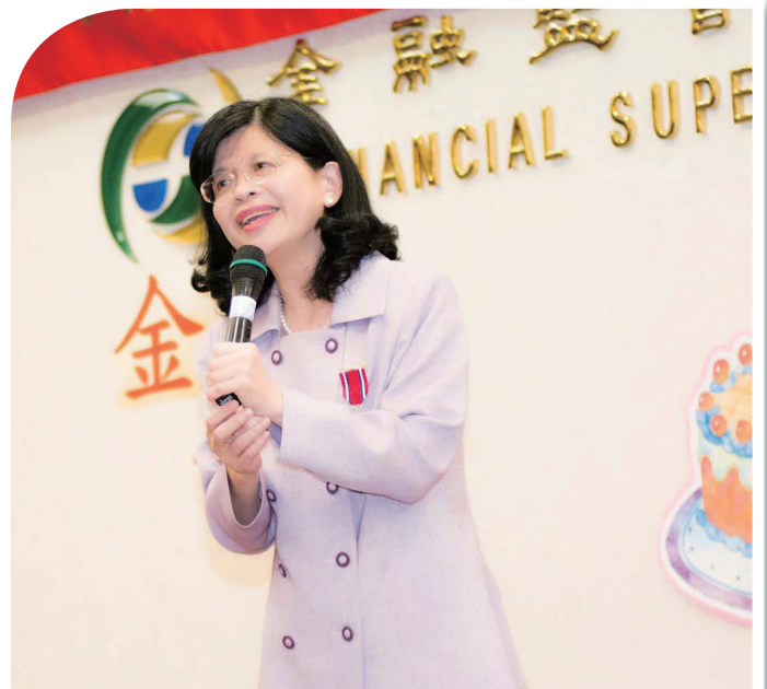
畢生理首於研究桌上，曾任金融監督管理委員會委員。

經濟學乃是我職場上的必備專業，成天在這領域上打樁、豎樑、建屋，追蹤瞬息萬變的金融動態，分析前因後果的邏輯。昔日抱著書本在校園啃書時，校外的經濟正在起飛。臺灣曾以兩位數的經濟成長率笑傲鄰國，擁有亞洲四小龍之一的美譽，朝氣蓬勃。當時與經濟、商學有關的科系，多是丁