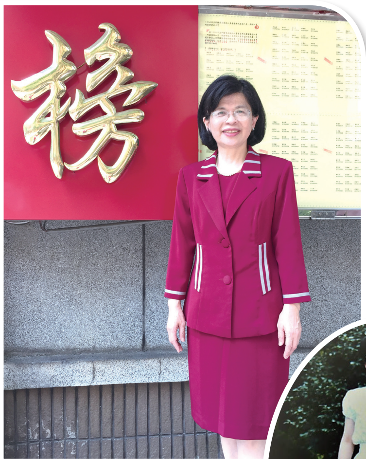
現任考試委員，擔任國家考試典試委員長。