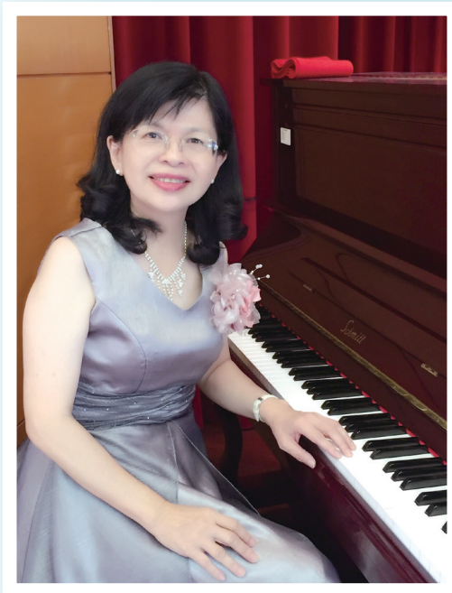
琴弦樂音豐富人生。