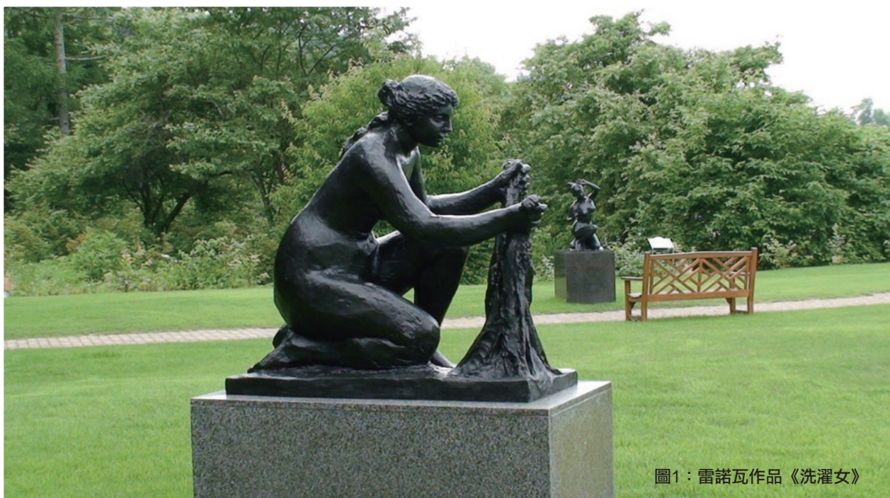
圖1：雷諾瓦作品《洗濯女》