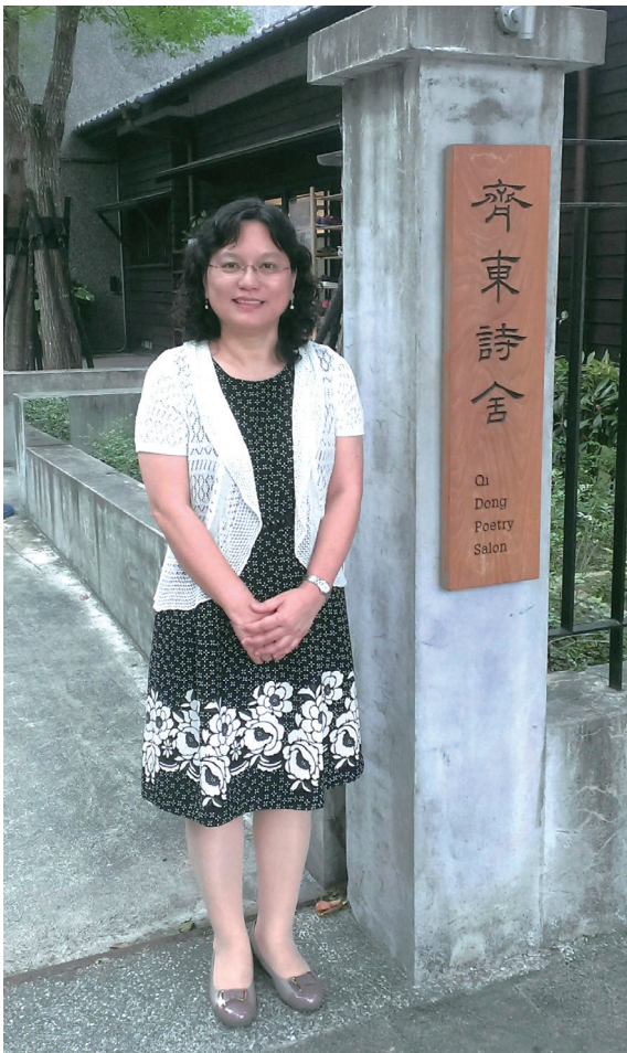
愛詩並愛與詩終生為伍。

魚逃走了，實際上是在影射人際關係，讓人窒息的愛，有時候一種無意識的開玩笑或輕拍一下就是致命一推。」但只要活著就有希望，所以她寫了<給我一座山>。「我曾經跟小學生分享，問他們想要什麼東西？要用來做什麼？有人說『給我很多錢，我會去救濟窮人』，有人說『給我一部電腦，我要用它來宣告世界和平』。每個人心裡都有一個小孩，藏著最初的天真的夢想」。所以，童詩不是單單給兒童看的，凡是童心未泯，和關心兒少的，都是讀者。