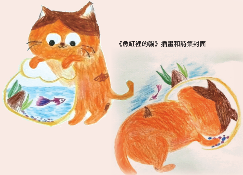
《魚缸裡的貓》插畫和詩集封面

我家的花貓 在金魚死掉以後 跳進空的魚缸 住了好幾天都不出來 喵喵喵喵 牠一定在說 「小金魚，你到哪兒去了 趕快回家來呀 我只是開個玩笑 輕輕咬你一口而已」