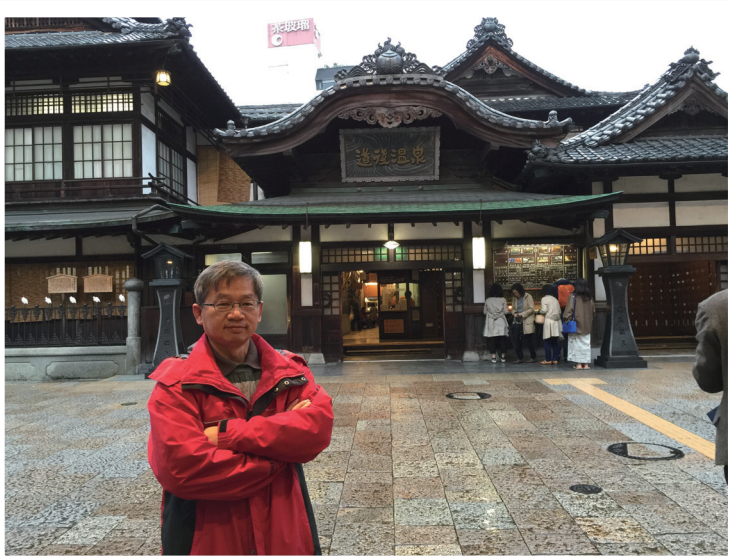
我在2015年4月曾經造訪過日本四國松山市有名的道後溫泉本館，體驗日本傳統溫泉澡堂樂趣。當地政府決定將在2017年秋天起關閉該館進行耐震補強工程，期程可能長達7年。

日本四國的松山市有一個很有名的古老的溫泉，叫「道後溫泉」，號稱是日本3古湯之一，據稱有3千年的歷史。我在2015年4月曾經造訪過道後溫泉本館，該館據傳為宮崎駿動畫電影《神隱少女》（千と千尋の神し）裡名為「油屋」的澡堂的靈感來源之一。最近得知，當地政府認為該館乃重要歷史建築，但建築老舊恐難耐強震，於是決定將在2017年秋天起關閉該館進行耐震補強工程，但封館之後的評估、規劃及施